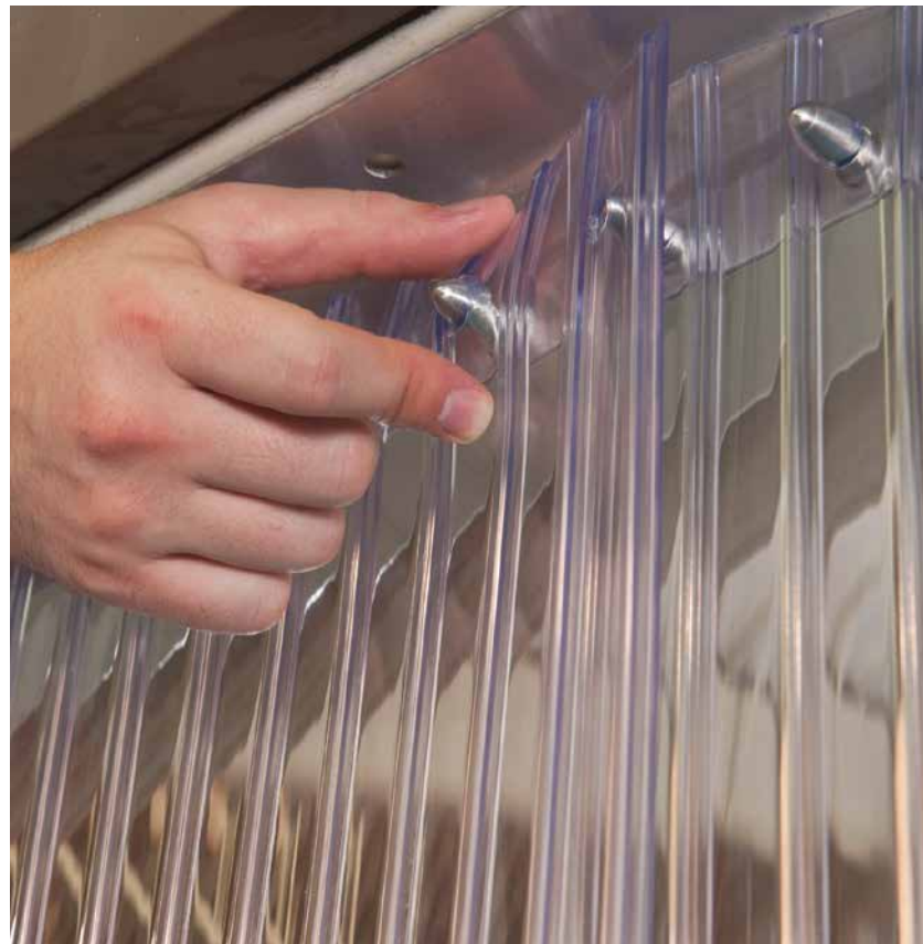
Sistema de fijación de tiras en forma de balas, no requiere el uso de herramientas.