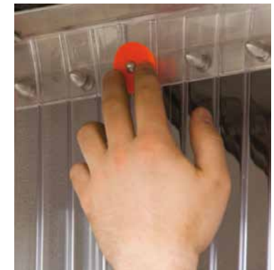
Discos fluorescentes de seguridad. MODELO: 09-477104-168.