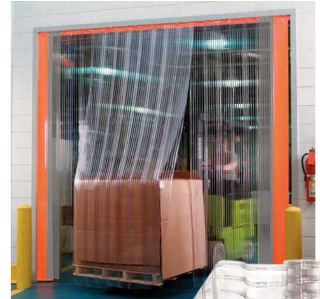
En esta foto, tira de 305 mm (12") de ancho.

Todas las medidas son nominales. Pueden variar ±10%.